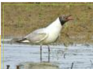
La Mouette rieuse

Taille : 35 à 39 cm Poids : 225 à 350 gr Envergure : 86 à 99 cm