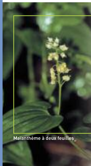
Maïanthème à deux feuilles

Quelques espèces menacées au niveau régional sont présentes sur le site (Muguet de mai, Maïanthème à 2 feuilles...). Il convient donc de les sauvegarder en mettant en place une gestion adaptée. Bien entendu lors de votre balade abstenez-vous de les cueillir, vous participerez ainsi à leur protection.